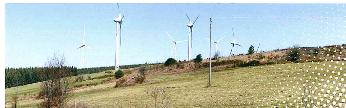
Depuis la route D66 (au niveau de l'entrée du parc éolien Le Margnès)

Par ailleurs, les discussions avec la municipalité de Fontrieu et le SDET se poursuivent au sujet de leur prise de part au capital. Cet aboutissement permettra aux collectivités de bénéficier davantage des retombées financières issues de cette production locale d'électricité.